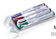
MARKER PENS BOARDMARKER